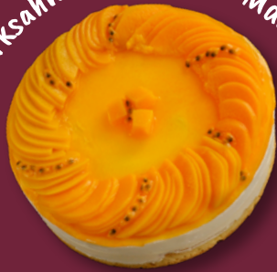
Quarksahne mit Pfirsich-Maracuja und Joghurt